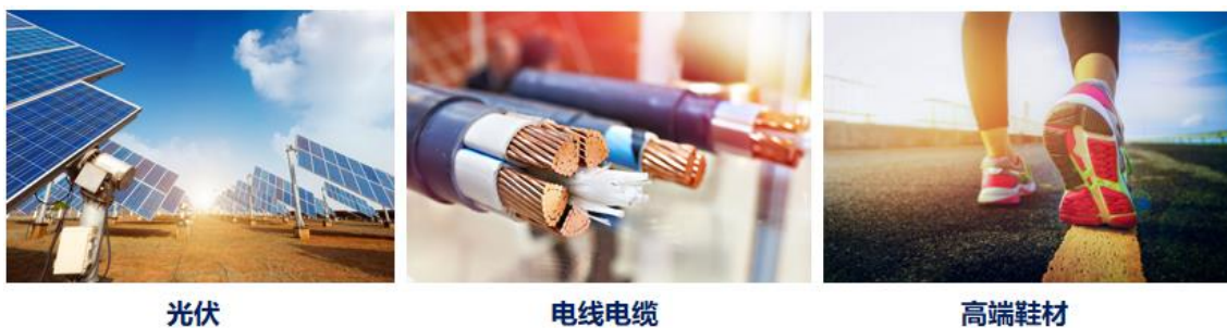
图：EVA 高端料应用场景

公司 EVA 高端料聚焦于高附加值的高毛利产品，尤其是国内需要大量依赖进口、附加值较高的高 VA 含量产品，处于行业领先水平，广泛应用于光伏胶膜、电线电缆、高端运动鞋、热熔胶、涂覆膜等领域。目前公司 EVA 产品主要为光伏胶膜料、电线电缆料和高端鞋材料等高 VA 含量的高端产品。VA 是生产 EVA 的主要原料，公司所生产 VA 主要用于配套现有 EVA 产能需求，其余部分外售。