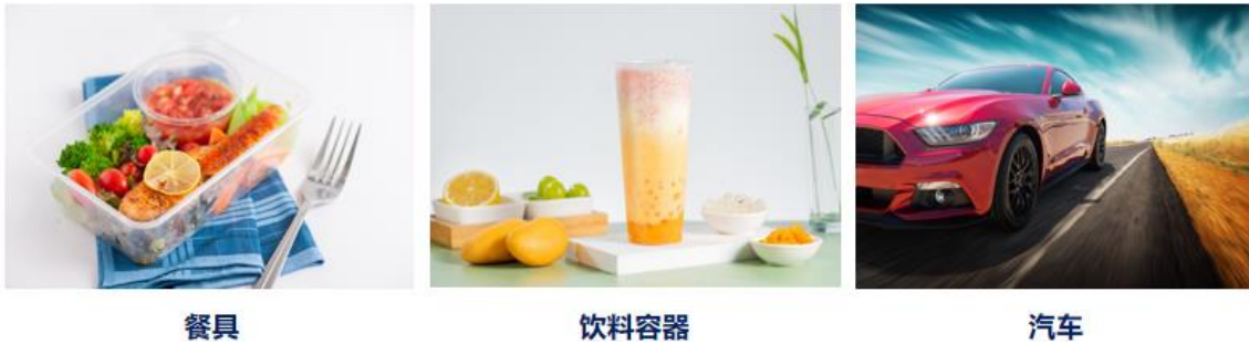
图：PP 专用料应用场景