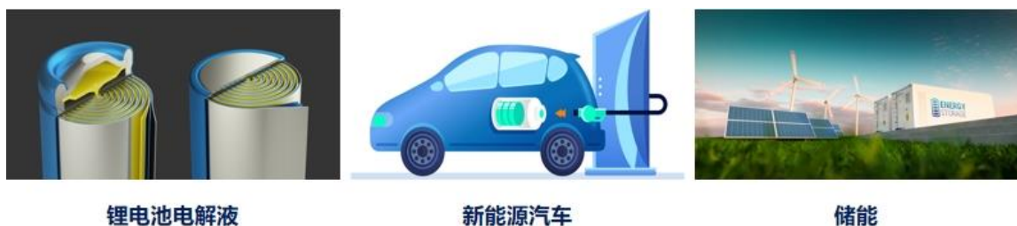
图：电解液溶剂及添加剂产品应用场景