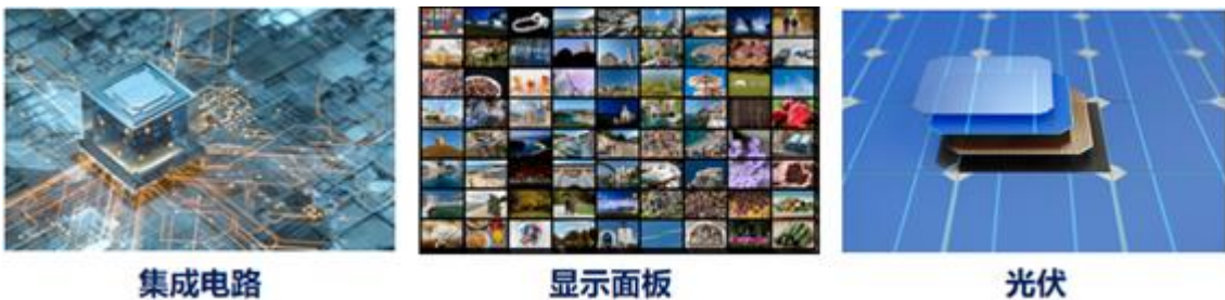
图：电子特气应用场景

电子特气是半导体集成电路、显示面板、光伏能源、光纤光缆等电子工业生产制造过程中不可缺少的关键基础性材料，是仅次于硅片的第二大晶圆制造材料。由于技术门槛高，电子特气（纯度 5N 及以上级别）长期以来一直被外国巨头垄断，属于国家发展战略关键材料，被国家工业和信息化部列入《重点新材料首批次应用示范指导目录》。根据电子材料咨询公司 TECHCET 统计，2023 年全球电子气体市场规模约 69.5 亿美元，其中电子特气 51.2 亿美元，是电子气体中价值量最高的类别。2023 年中国电子特气市场规模 249 亿元。在国家鼓励关键战略材料供应链自主可控和市场需求的双重驱动下，电子特气产业未来增长趋势明确，发展空间大。