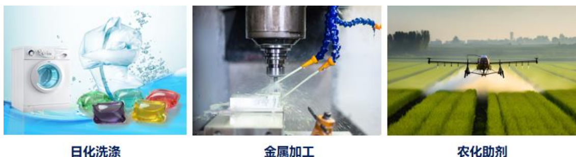
图：特种表面活性剂应用场景

非离子表面活性剂广泛应用于日化、纺织、金属加工、农化、造纸、食品等领域，覆盖国民经济和日常生活的各个方面。根据卓创资讯统计，2023 年我国非离子表面活性剂总消费量约 169 万吨，同比增长超 10%。随着消费升级和下游应用领域的不断拓展，特种表面活性剂作为非离子表面活性剂中的重点发展领域将保持快速增长。