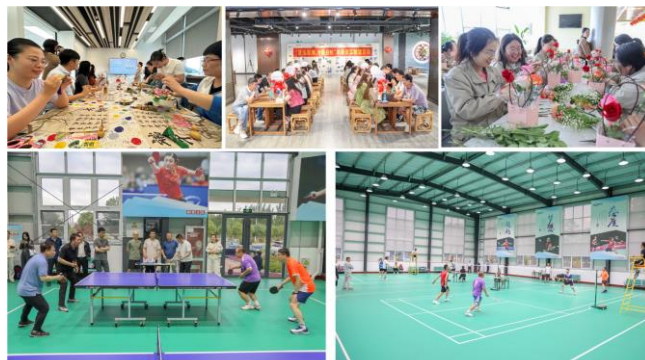
图：公司员工关怀活动

（三）在人文关怀方面，公司积极帮助困难员工，高度重视员工身心健康。报告期内，公司工会向困难员工提供救助金；开展员工读书分享会、心理健康辅导专题讲座、羽毛球比赛、乒乓球比赛、三八妇女节主题活动、优秀员工家属开放日活动、单身员工联谊活动、员工生日会、工地慰问送清凉等形式多样的员工活动，提升员工的幸福感和获得感。