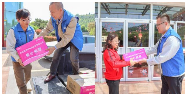
图：“泓基金”志愿者向枣庄市儿童福利院送去爱心物资

（二）在弱势帮扶方面，公司长期对枣庄市儿童福利院进行爱心慰问。报告期内，公司内部公益平台“泓基金”组织志愿者两次前往枣庄市儿童福利院，捐赠爱心物资，为福利院儿童送去温暖。